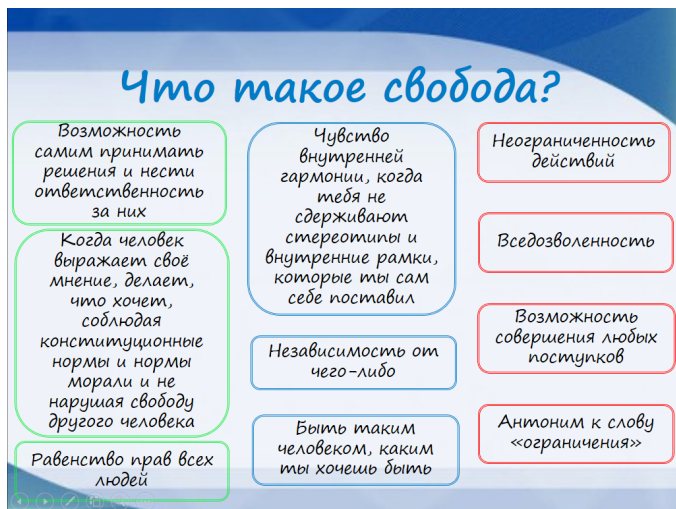
Рисунок 1. Результаты ответа на вопрос «Что такое свобода?»

С целью выявления понимания свободы и отношения молодежи к ней среди студентов-первокурсников было проведено исследование.