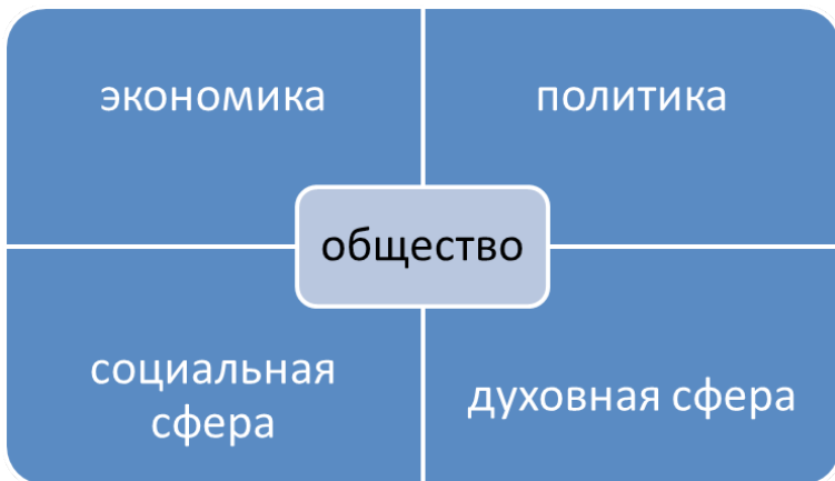
Рис. 1 Подсистемы общественной жизни

Общество в позитивизме есть особая система, состоящая из ряда подсистем, которые можно представить следующим образом (см. рис. 1)